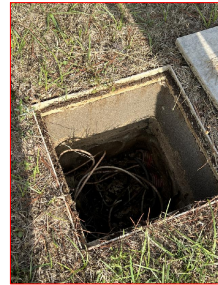
Foto dei chiusini e dei relativi pozzetti